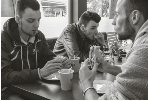
2 Drei junge Männer treffen sich zur Mittagspause.