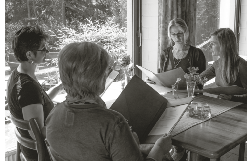
3 Vier Frauen wählen aus Speisekarten.

Kräftig und beleibt war der männliche Wohlstandsbauch nicht verpönt, sondern ein Zeichen von Macht : »Wir haben es geschafft, schaut her, es geht uns wieder gut!«